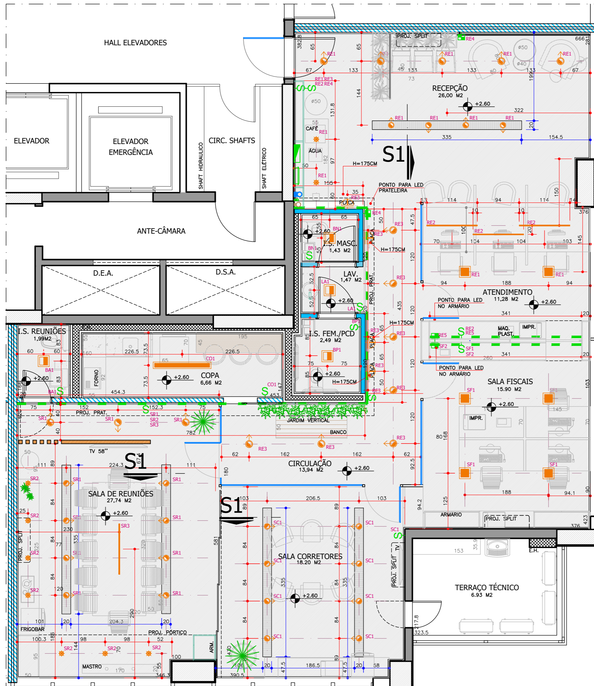
PLANTA DE FORRO E ILUMINAÇÃO ESCALA 1:50